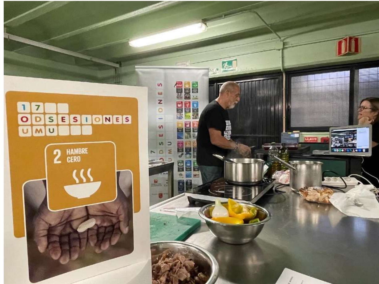
Workshop to avoid food waste